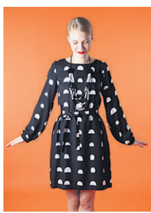
MIA-MEKKO 129 €

MYÖS VERKOSSA: MARIMEKKO.FI/VERKKOKAUPPA