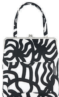
RAAMI-LAUKKU 83 €