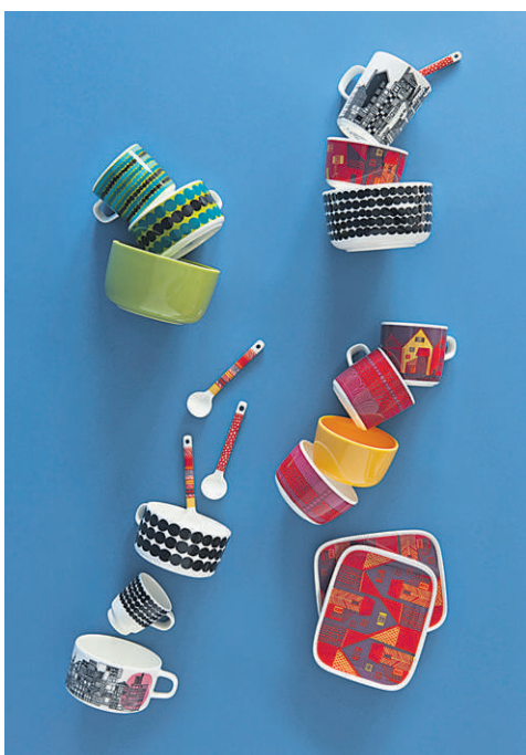
OIVA-ASTIOITA ALK. 8,50 €

TERVETULOA - TORSTAISTA SUNNUNTAIHIN 24.-27.10.